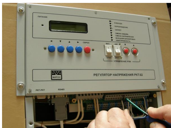
Рис 2: Метод монтажа